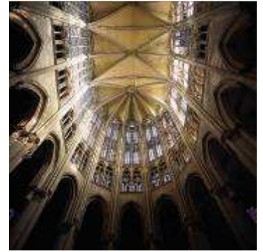
La cathédrale de Beauvais

Le chiffre 5 symbolise le pentagone. Il représente l'Humanité. C'est le chiffre de la création augmenté de l'unité divine (4+1), c'est aussi le chiffre de l'Homme (les cinq doigts, les cinq sens). Le chiffre 5 correspond également aux cinq plaies du Christ, représentées par les cinq croix gravées sur l'autel. L'humain est le fameux 5 ème élément, l'amour, ce qui en fait son unique valeur. Il cherche sa direction parmi les 4 points cardinaux (voir le symbole du 4) mais il oublie de regarder vers ce 5 ème point "cardinal" qui est au dessus de sa tête : le ciel !