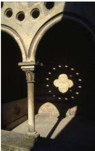
Le cloître de la cathédrale de Laon

Le chiffre 6 – l'hexagone – symbolise la puissance, le surhumain. Cette idée de puissance est manifeste dans les 6 jours de la création (l'hexameron). Une relation existe entre le 6 et le Christ. Les deux premières lettres du mot Kristos (Christ en grec) constituent une étoile à 6 branches symbole du salut universel.