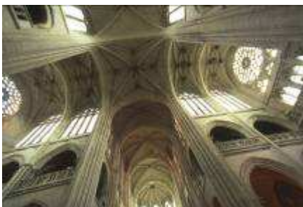
La cathédrale de Senlis