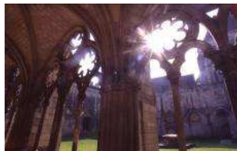
La cathédrale de Noyon