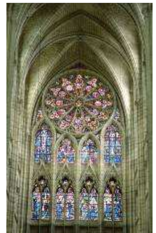
La cathédrale de Soissons

Le chiffre 13 est le symbole du Malheur.